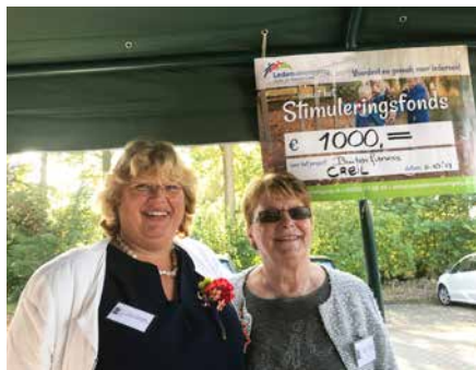
Fitness in Creil

Alle projecten zijn inmiddels uitgevoerd.