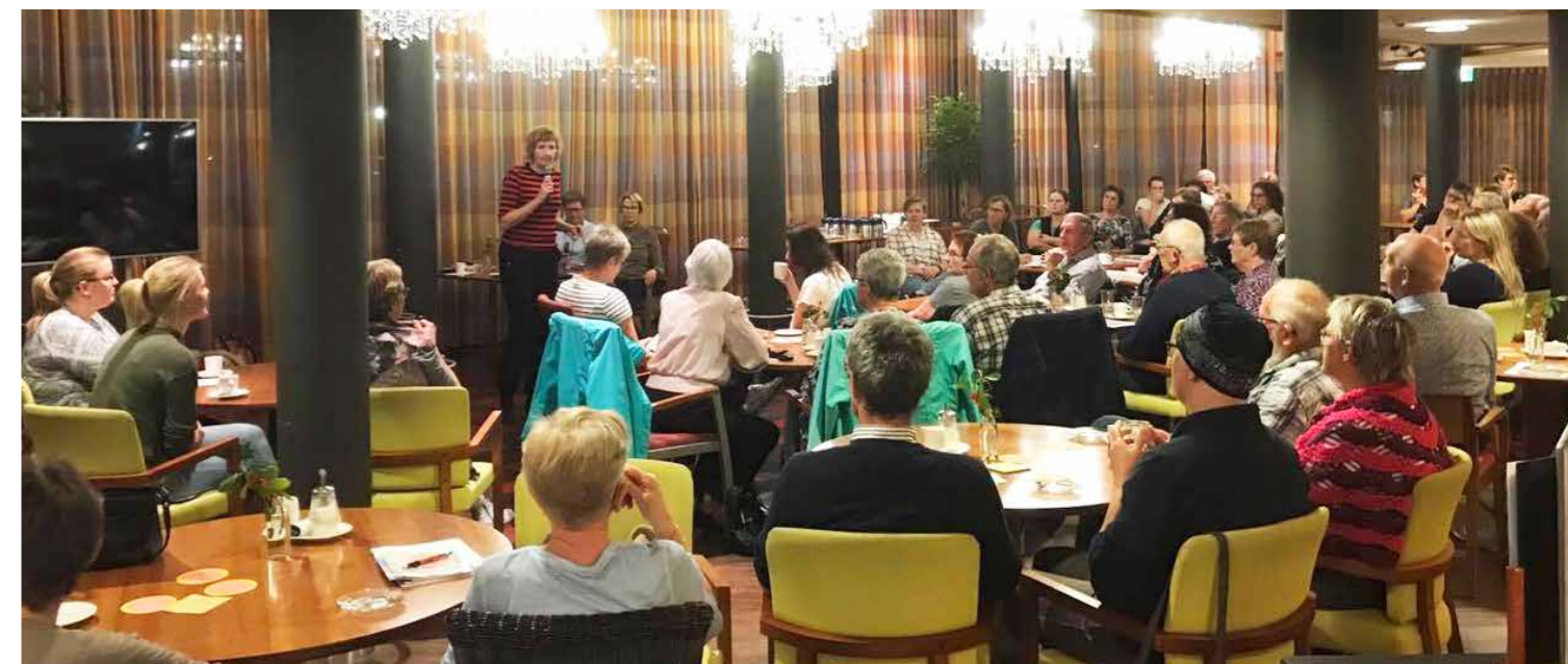
Voorlichtingsavond "Kwaliteit van levenseinde"