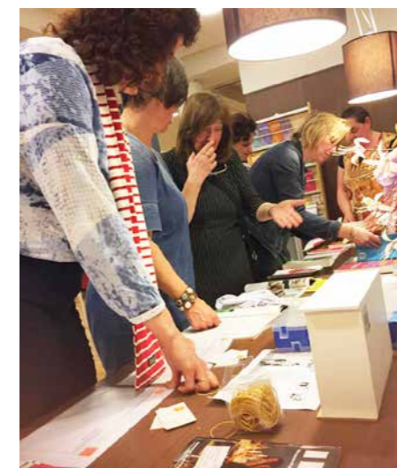
Het nieuwe opruimen