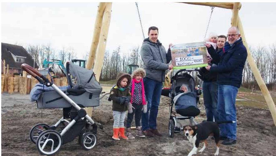
Aanleg moestuin in Espel