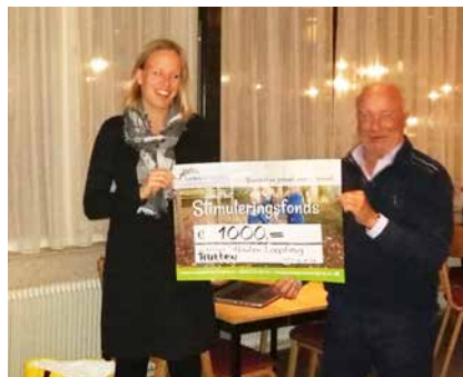
Nieuwe loopbrug in Rutten