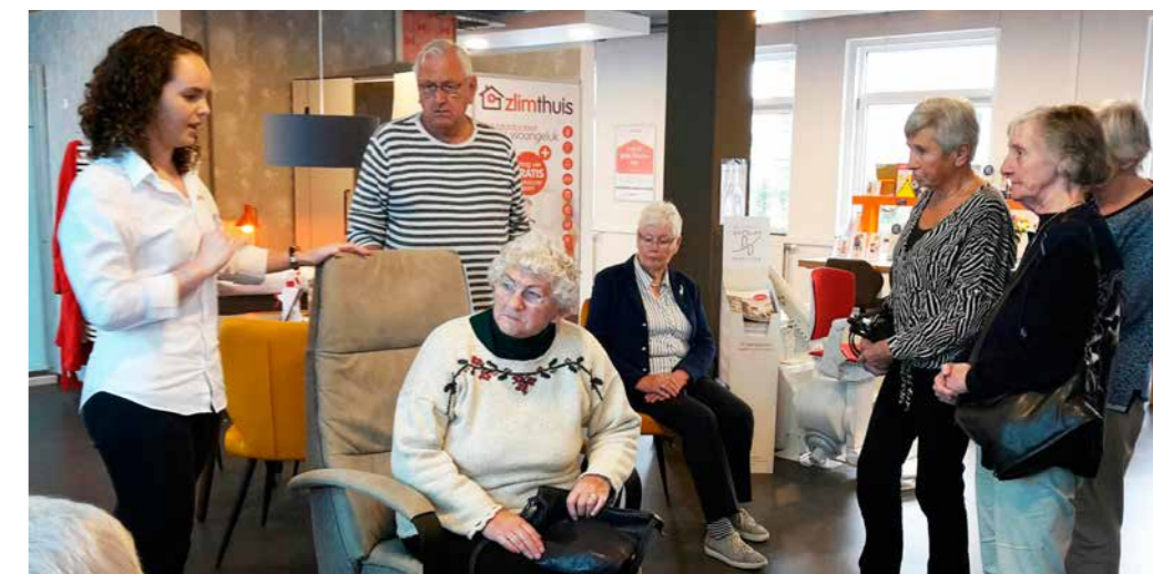
Beleefhuis van Zlimthuis in Hoogeveen